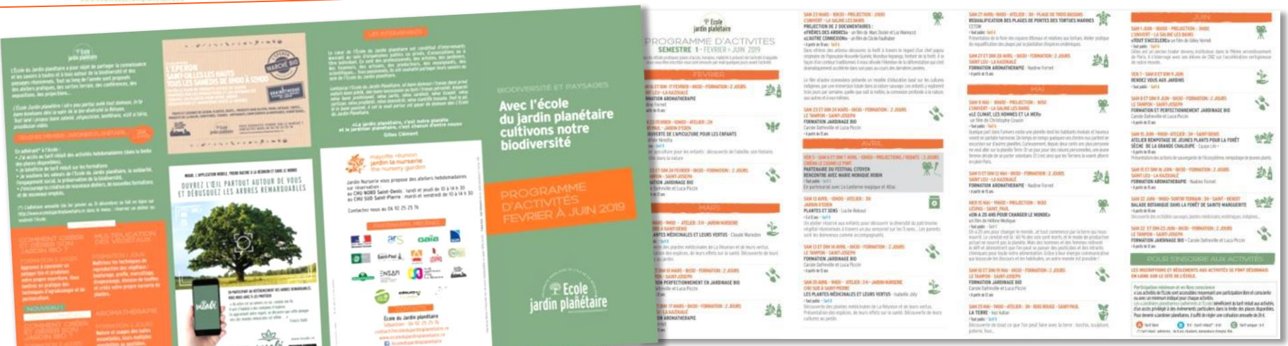
Flyers 1 er semestre 2019 500 exemplaires.