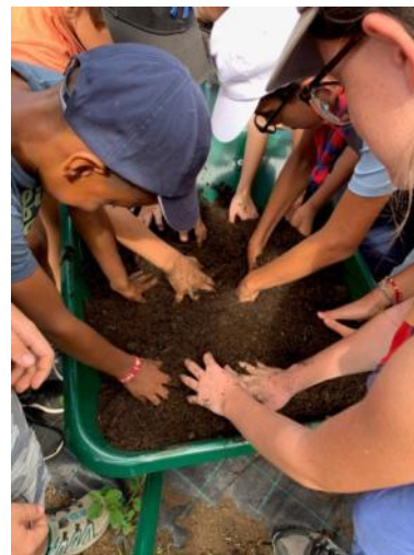
Action citoyenne de "semis d'espèces endémiques", Sans-Souci, le 4 mai 2019.

Outre la passation de savoirs sur les plantes aux générations en place et futures en un jardin partagé permettant la mise en pratique de ces connaissances, une pépinière de plantes endémiques permet la plantation d'espèces adaptées au contexte écologique et historique local.