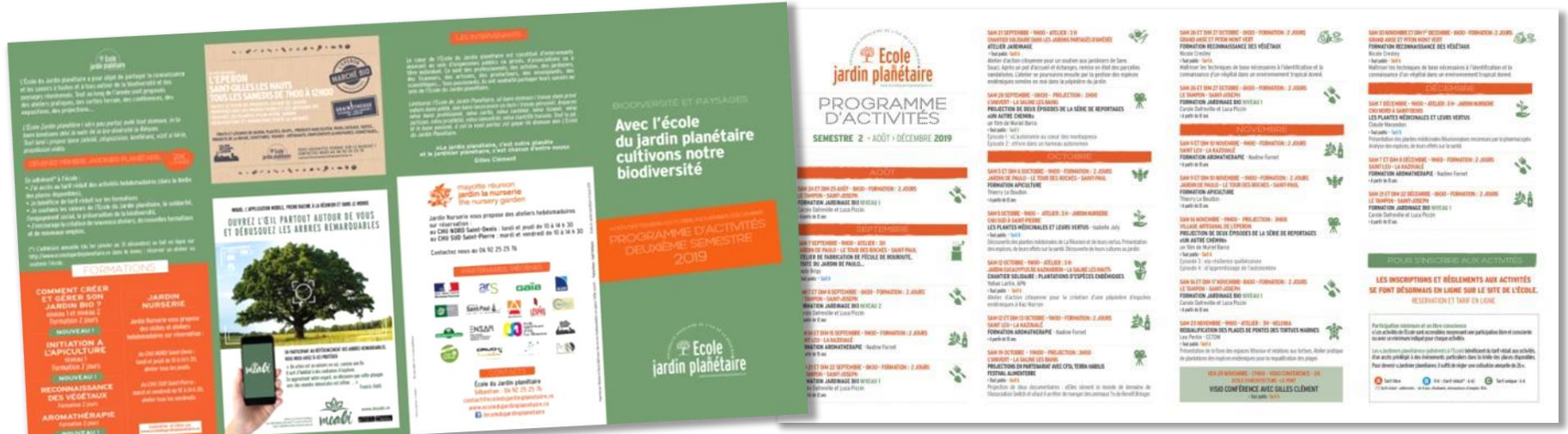
Flyers 2 nd semestre 2019 500 exemplaires.