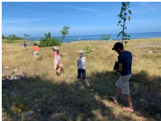
Action citoyenne de "requalification des plages de ponte des tortues marines", Saint-Leu, le 27 avril 2019.

La restauration de la végétation littorale, en limitant l'érosion des sols, les effets de la houle et la pollution lumineuse, permet de recréer les conditions propices à la ponte et l'incubation des œufs des tortues marines, au moyen notamment, de diverses espèces indigènes et endémiques favorisant la « plume olfactive » (la mémoire des odeurs permettant aux tortues de reconnaître et revenir sur la plage sur laquelle elles ont vu le jour).